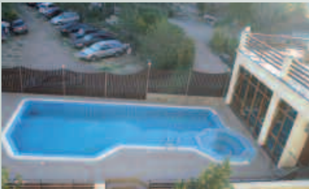
Apartamenty nowobogackich Rosjan