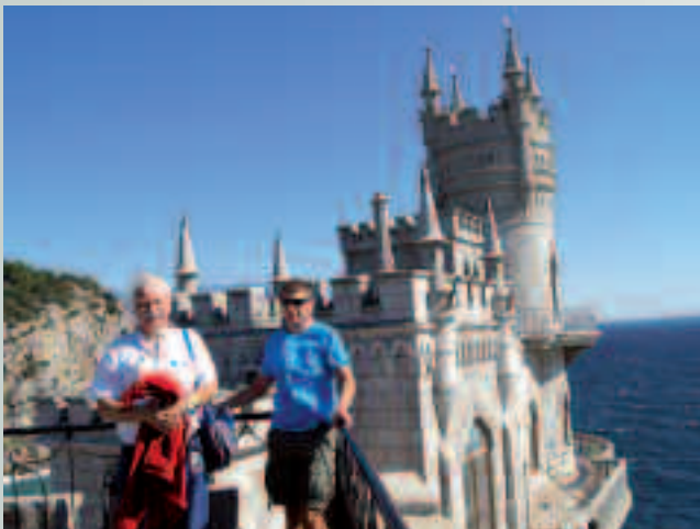
Jaskółcze Gniazdo z bliska