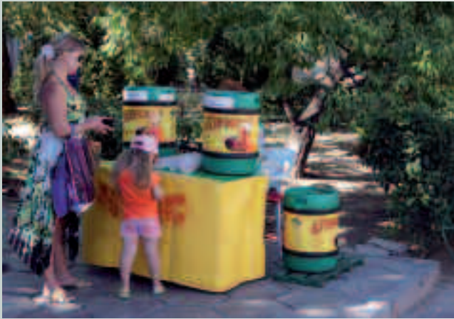
Kozacki kwas chlebowy

F eodozja czy Teodozja? Teodozja to współczesna, a zarazem starożytna nazwa (czyli dana od bogów). Feodozja to wersja ukraińska i podobnie brzmiąca wersja rosyjska. A tak naprawdę to miasto ma korzenie w czasach kolonii greckiej, założonej przez osadników z Miletu około VI w. przed naszą erą. Później przechodziło z rąk do rąk (Rzymianie, Hunowie, Alanowie). Jako Kafa było główną faktorią handlową Genui,