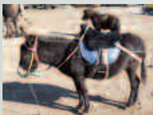
Na ulicach można spotkać prawdziwą menażerię