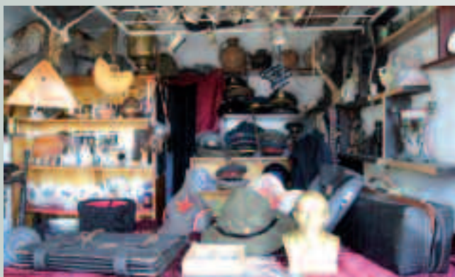
Lenin w dobrym towarzystwie