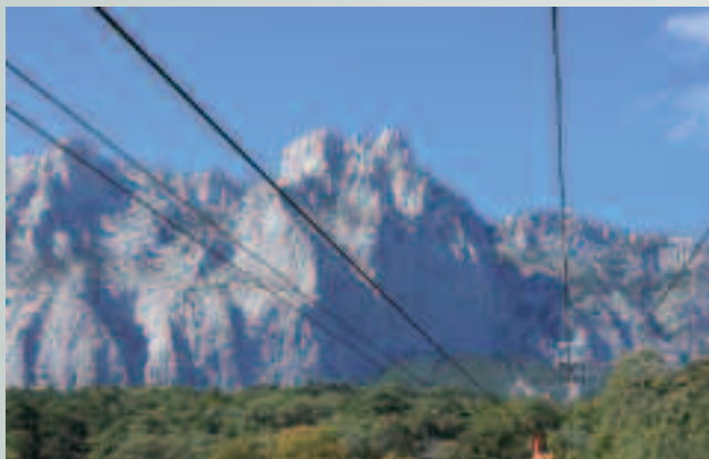
Kolejką linową wjeżdżamy na Górę Krymu

K iedy w Jałcie zaparkowaliśmy samochód w miarę bezpiecznym miejscu, skoro świt ruszyliśmy pod biuro podróży złapać jakąś ciekawą wycieczkę. Niestety, sztormowa pogoda nie chciała odpuścić. Może więc Aj-Petri... Brzmiało oryginalnie. Dostać się na Górę Krymu można na dwa sposoby. Drogą lądową prywatnymi busami, przez serpentyny wykute w tysiącmetrowej pionowej skale albo dla mających zaufanie dla