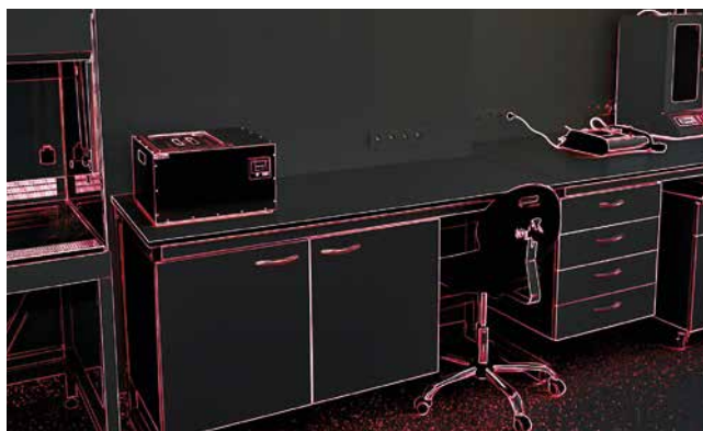
Fot. ilustracyjne – Andrzej Piechocki

Wielu lekarzy ma już uprawnienia emerytalne. Lepiej nie myśleć, co byłoby, gdyby jednego dnia wszyscy odeszli na „stypendium ZUS”.